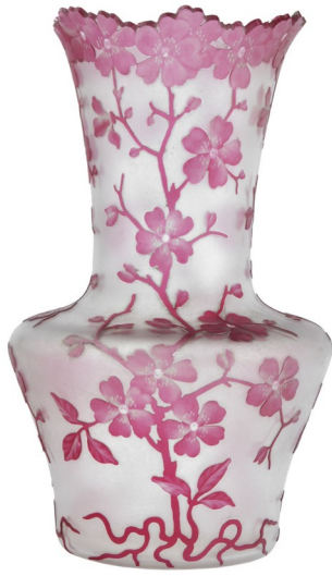
Vase Natal, décor Violettes, v. 1900

création Léon Ledru, VSL, cristal incolore doublé rose, soufflé, gravé à l'acide