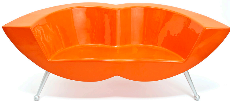
Canapé Clear Line 2011