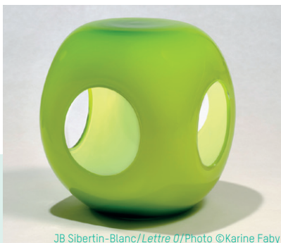
JB Sibertin-Blanc/Lettre O