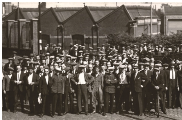
1936, le pays est bloqué dans son entièreté.