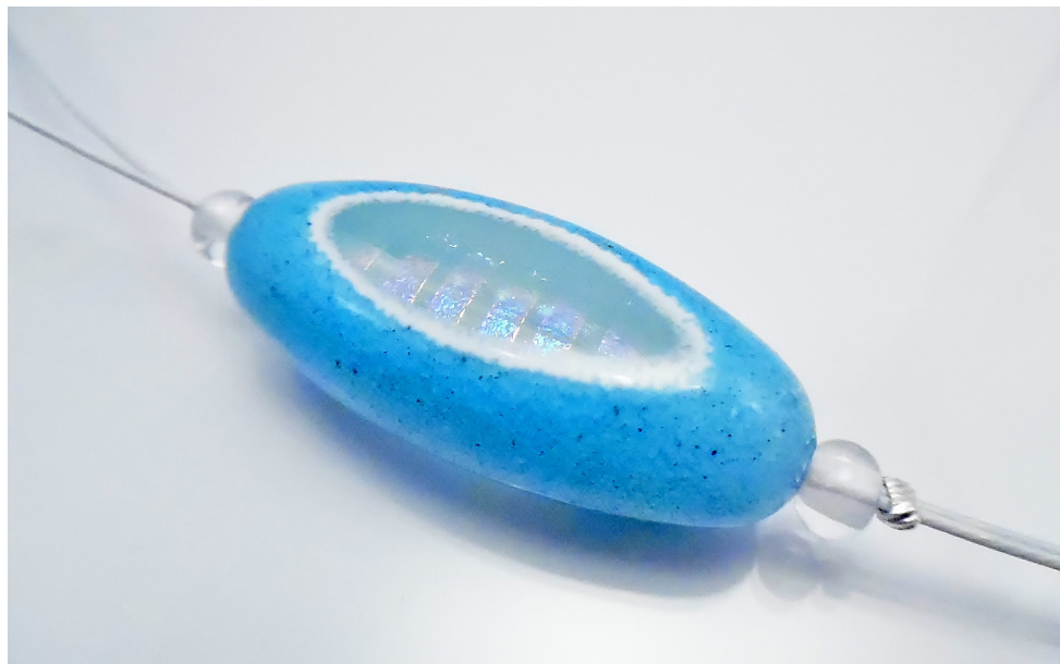
Pendentif «Overlay». Verre filé avec inclusion de verre dichroïque.