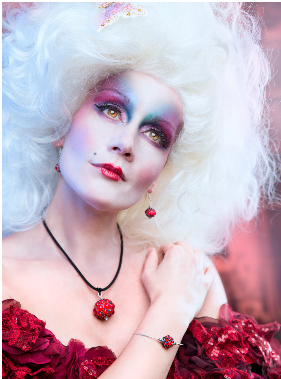
Parure rouge collection «Baroque». Verre filé et cloisonné à la feuille d'argent et verre réactif.