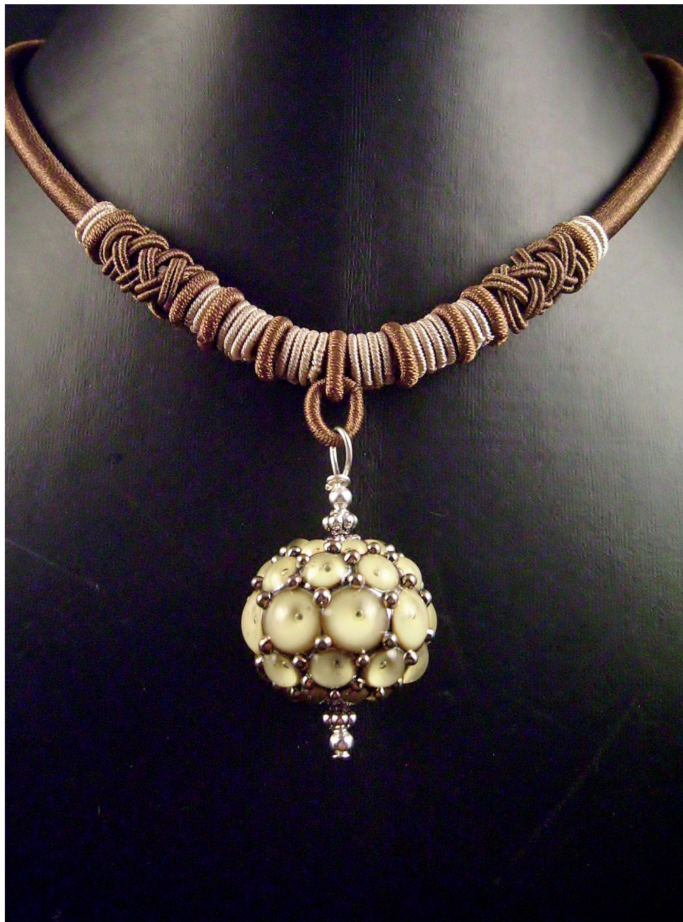
Pendentif monté sur collier en passementerie collection «Baroque». Verre filé et cloisonné à la feuille d'argent et inclusion de bulles d'air.