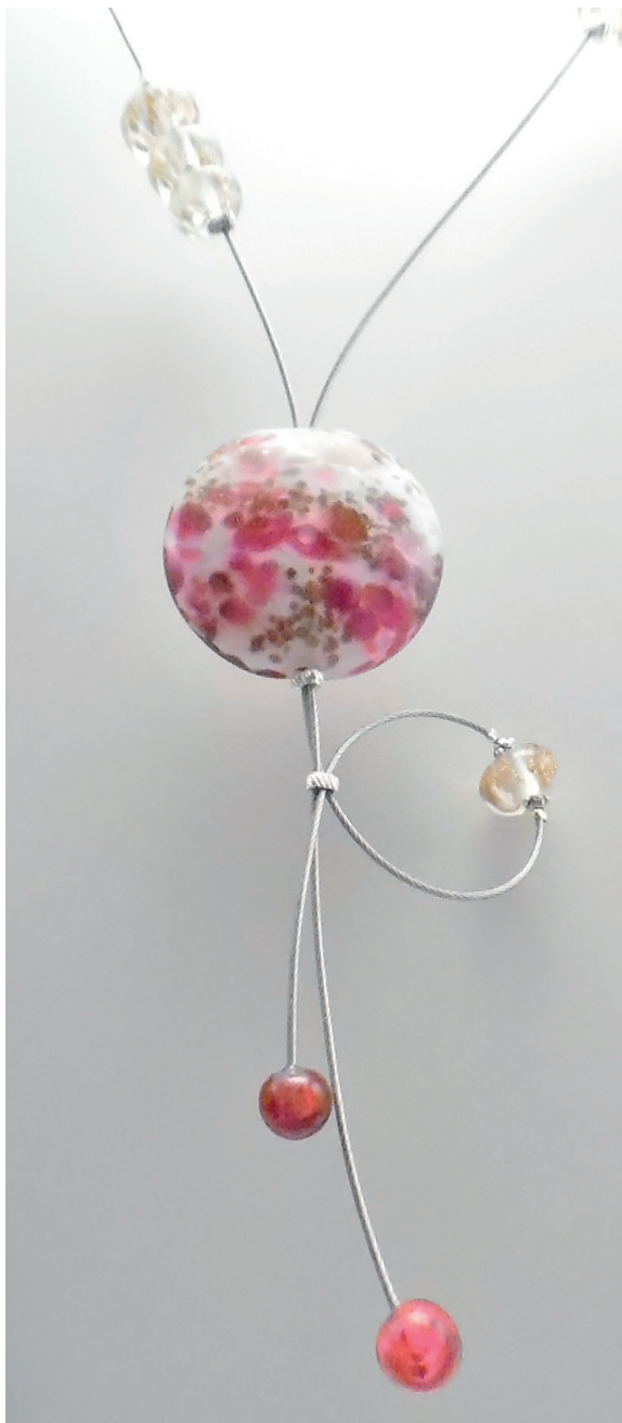
Collier collection «Carnaval». Verre filé avec frittage d'aventurine.