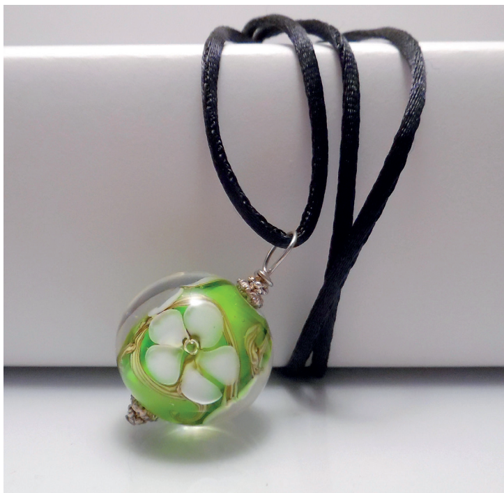
Pendentif sautoir collection «Flora». Verre filé avec décors par points posés et stringers puis enrobés.