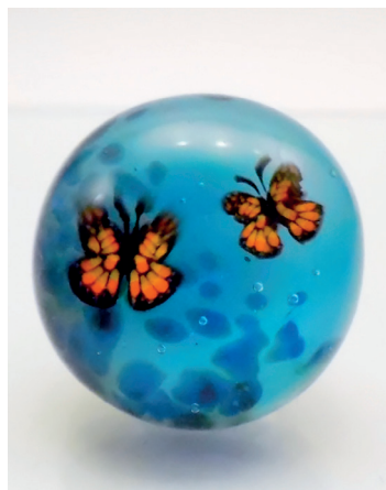
Bague collection «Papillons». Verre filé en multicouches avec inclusion de murines papillon et enrobé de verre transparent.