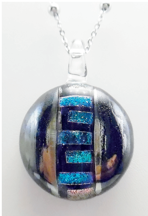
Pendentif collection «Jazzy». Verre filé avec assemblage de verre dichroïque et verre réactif.