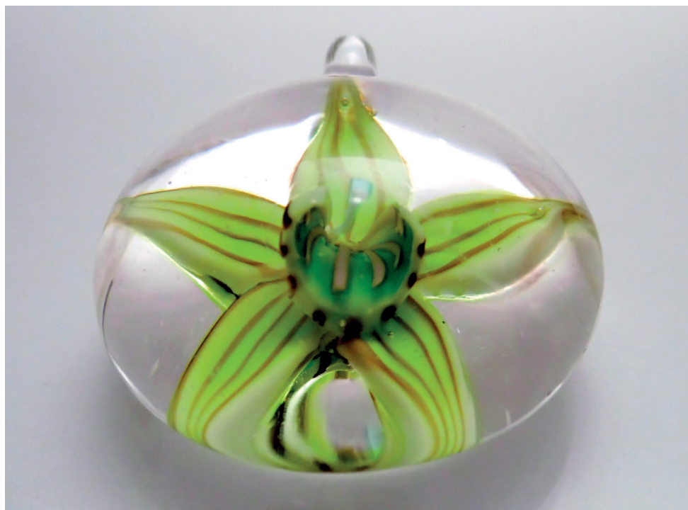
Pendentif collection «Orchidée». Cannes de verre sculptées, assemblées et enrobées sous vide.