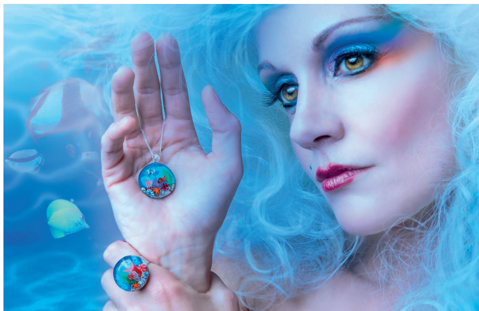
Parure collection «Récifs». Verre filé avec inclusion de murines sur le thème de la mer. © Gérald B