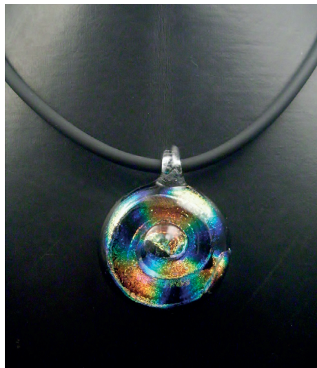
Pendentif collection «Vertigo». Verre filé en cabochon avec pose de verre dichroïque en spirale et enrobé.