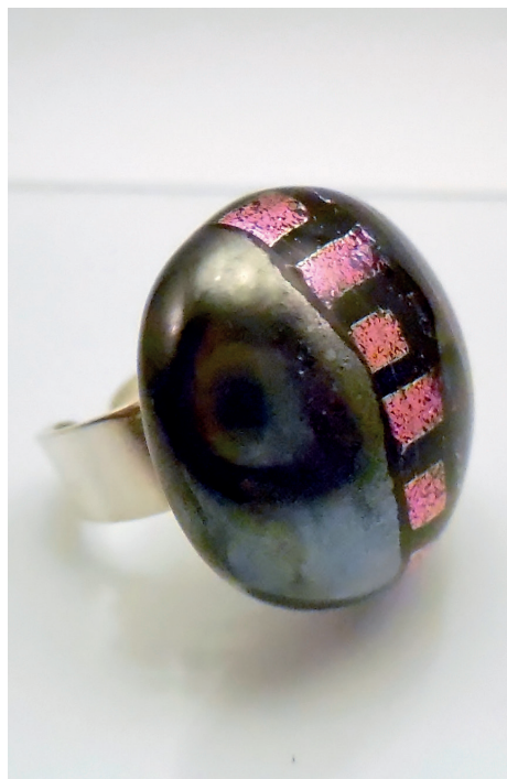
Bague collection «Jazzy». Verre filé avec assemblage de verre dichroïque et verre réactif.