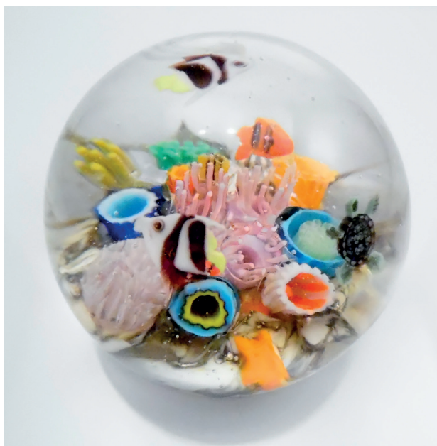
Presse-papier collection «Récifs». Assemblage de murines, cannes de verre sur le thème des fonds marins et enrobés sous vide.

La flore a un côté raffiné. Interpréter la délicatesse des fleurs avec du verre montre les infinies possibilités de cette matière, une pratique qu'Alain affectionne tout particulièrement.