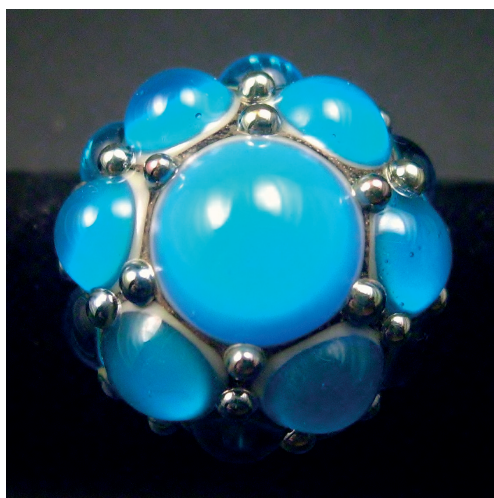
Remplacer par «Bague collection «Baroque». Verre filé et cloisonné à la feuille d'argent et verre réactif.