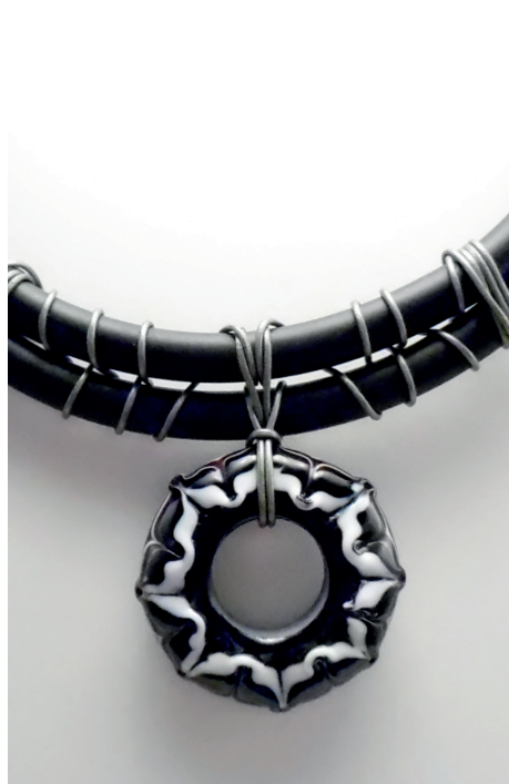
Collier «Clovis». Verre filé avec stringers de verre sculptés et étirés.