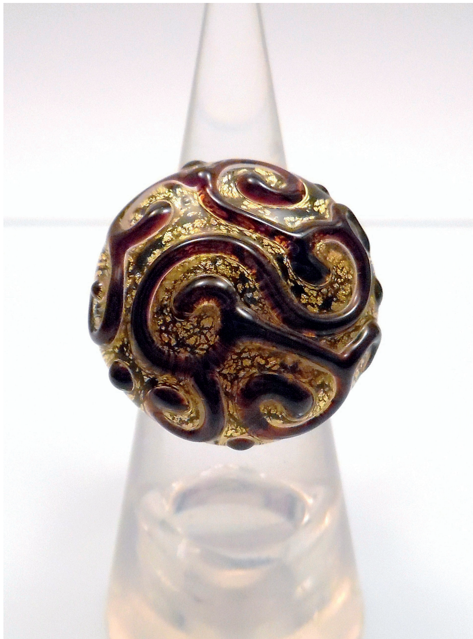
Bague collection «Arabesque». Verre filé avec inclusion de feuille or et pose de stringers en relief.