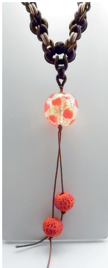
Collier sautoir collection «Rose de Bagatelle». Verre filé avec inclusion de feuille d'or et de murines de roses rouges.