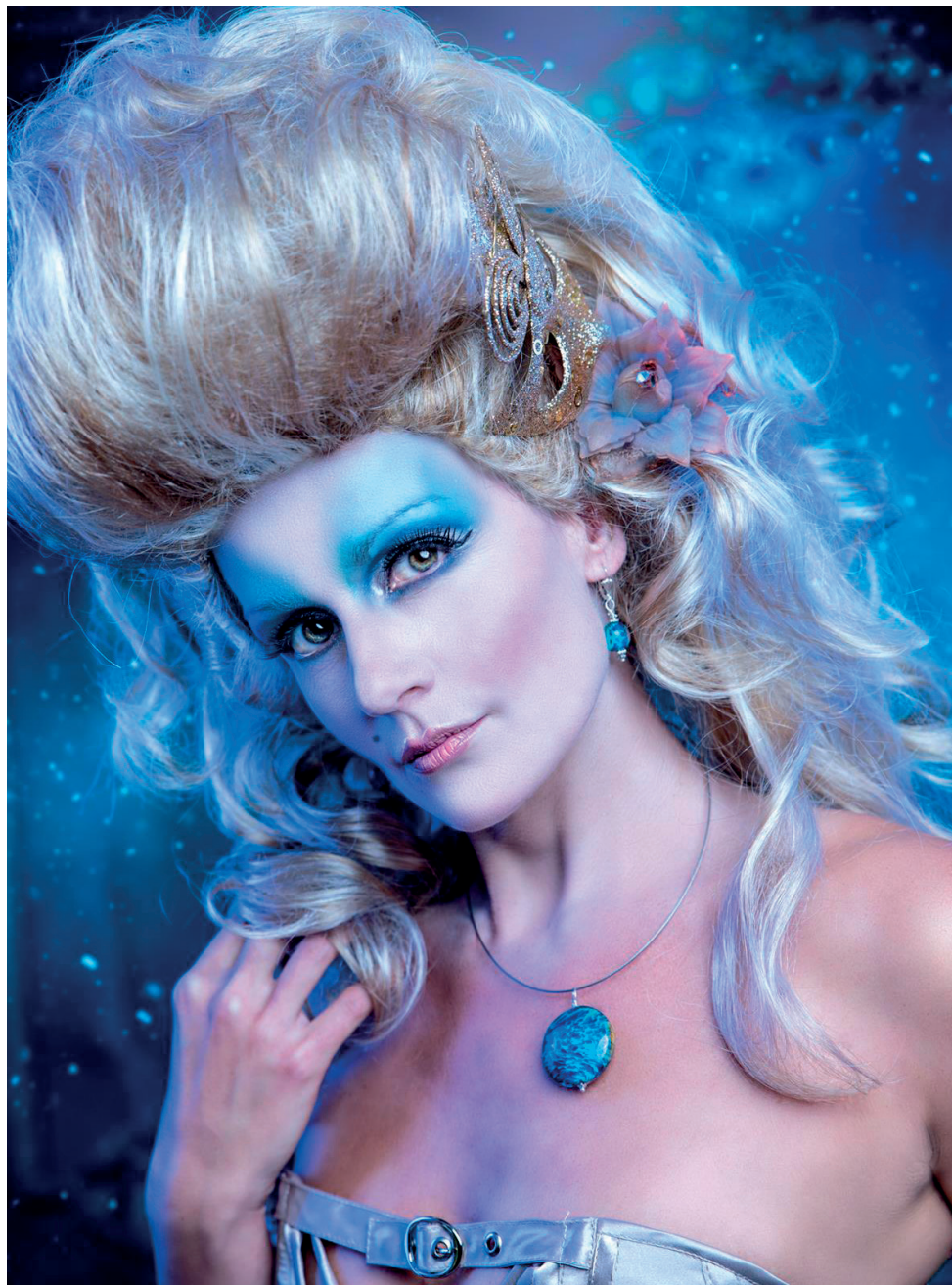
Parure collection «Galaxie». Verre filé, avec mosaïque de verre dichroïque et enrobage. © Gérard B