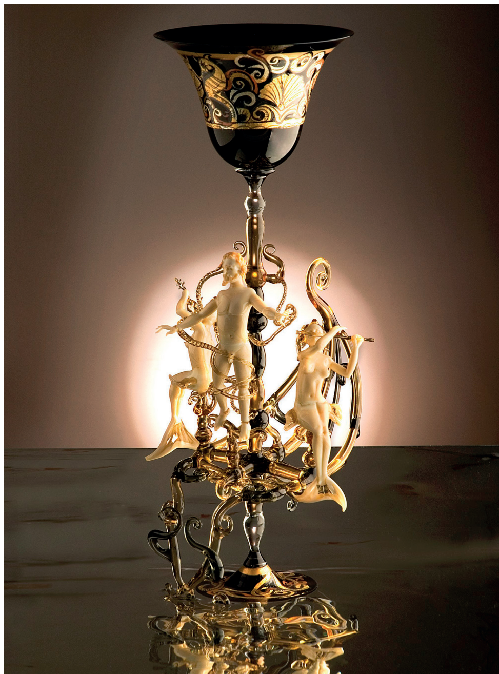
Lucio Bubbacco, Ulisse le Sirene