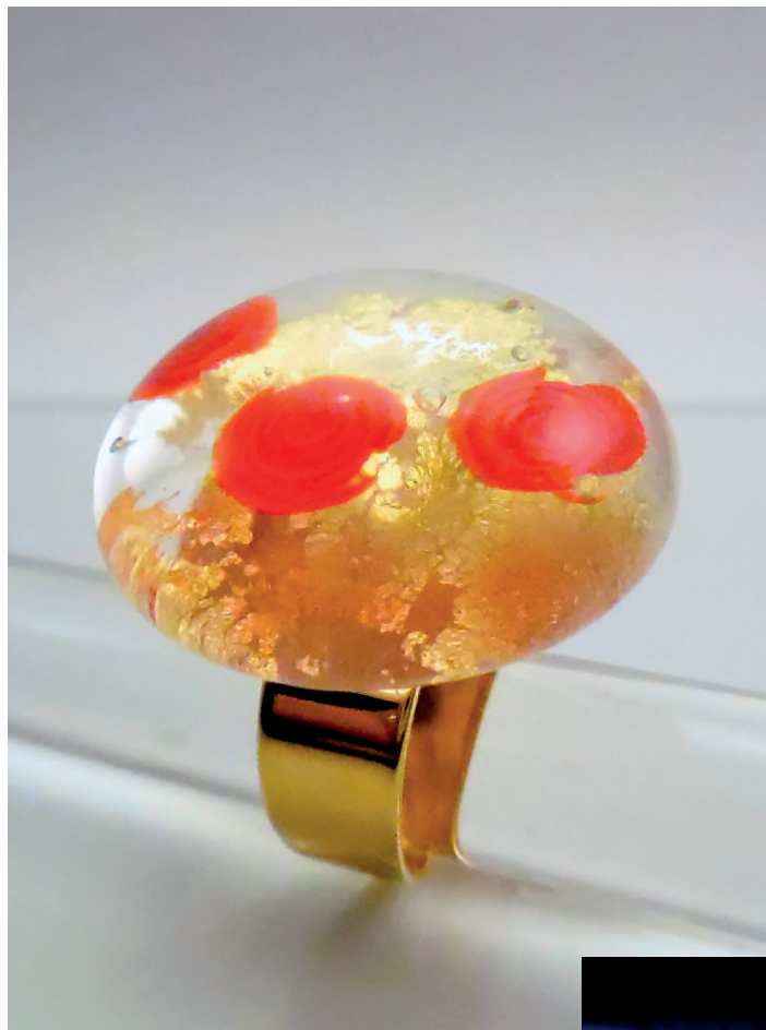
Bague à la feuille d'or collection «Rose de Bagatelle». Verre filé avec inclusion de feuilles d'or et de murines roses et rouges.