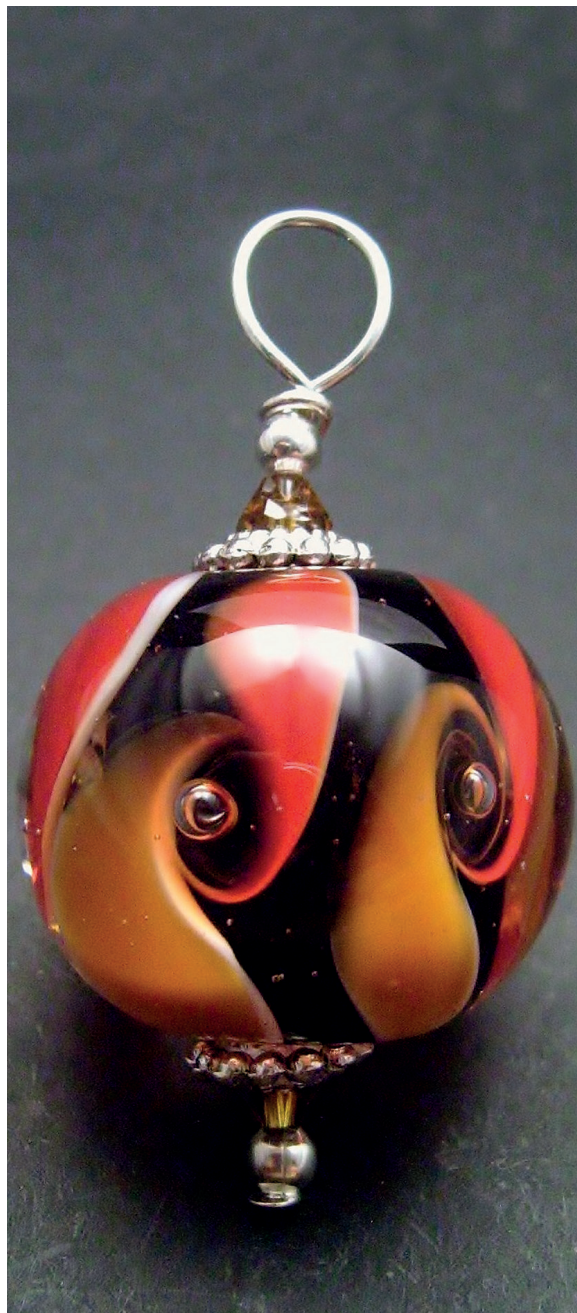
Pendentif collection «Hélice». Verre filé et travaillé en surface puis enrobé de verre transparent.