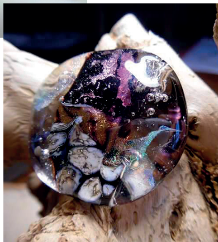
Pendentif modèle lentille collection «Quatre éléments». Verre filé et enrobé avec inclusion de verre dichroïque, aventurine et grille d'argent.