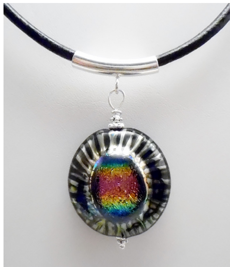
Pendentif collection «Oeil de paon». Verre filé et assemblage d'un cabochon de verre dichroïque avec capillaires de verre réactifs à forte teneur en argent.