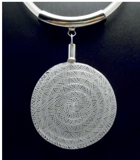
Pendentif collection «Sur le fil». Canne de verre tressée en reticello puis enroulée en disque