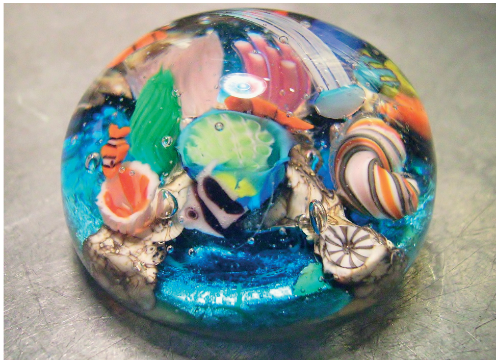
Presse-papier « collection «Récifs». Assemblage des murines, cannes de verre sur le thème des fonds marins et feuille d'argent enrobée sous vide.