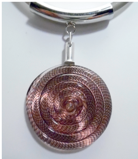
Pendentif collection «Sur le fil». Canne de verre tressée en reticello puis enroulée en disque