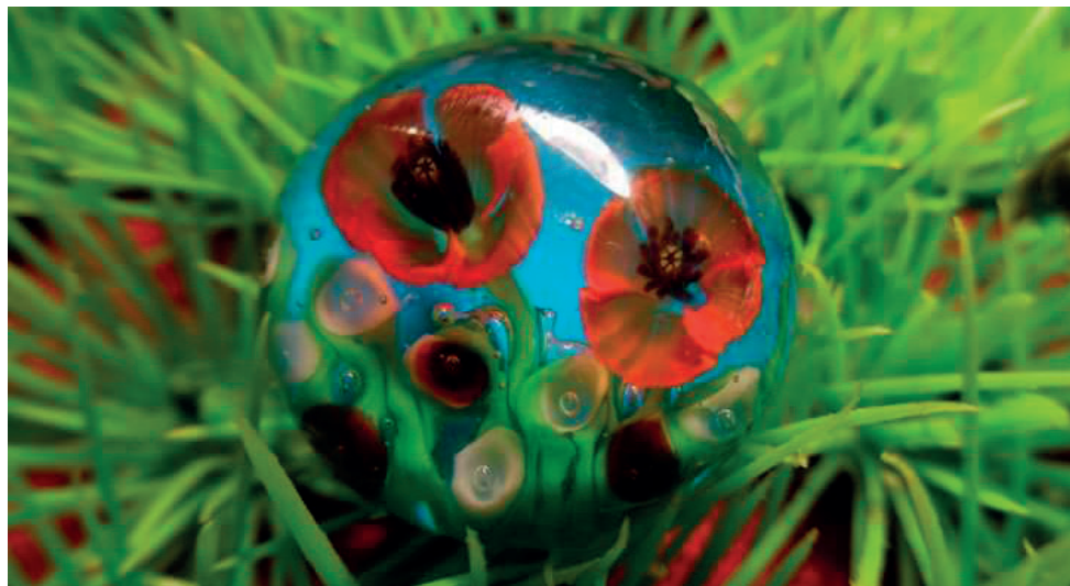
Bague collection «Coquelicots». Verre filé avec inclusion de murines coquelicots et fils de verre transparents et enrobés.