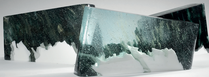
PERPETUAL – 2019 / Sculpture en verre « Build-in-Glass » 9 Pièces uniques – H 25 x L 46 x P 10cm / © Briolant