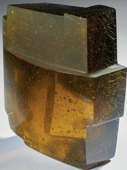
NOCTURAL – 2015 / Sculpture en verre « Build-in-Glass » Pièce unique – collection publique – H 22,5 x L 19,5 x P 9cm / © Briolant

A partir du 29 novembre, le public découvrira une sélection de près de trente œuvres de ces artistes hors du commun, avec la présentation de l'installation X-Press, acquise en 2017 par la Ville de Charleroi pour le Musée du Verre.