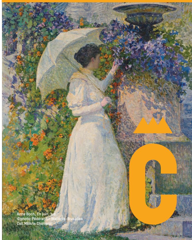
Anna Boch, En juin, s.d.