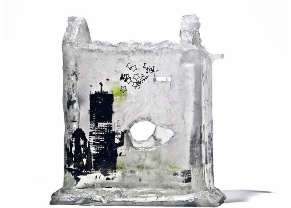
Vestige(s), sérigraphie sur pâte de verre, 2012