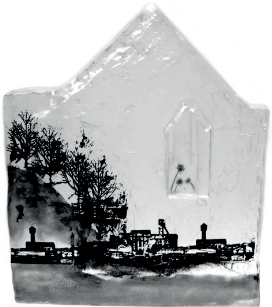
Façade industrielle, sérigraphie sur pâte de verre, 2018