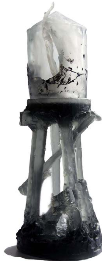
Réserve habitée II, sérigraphie sur pâte de verre, 2015