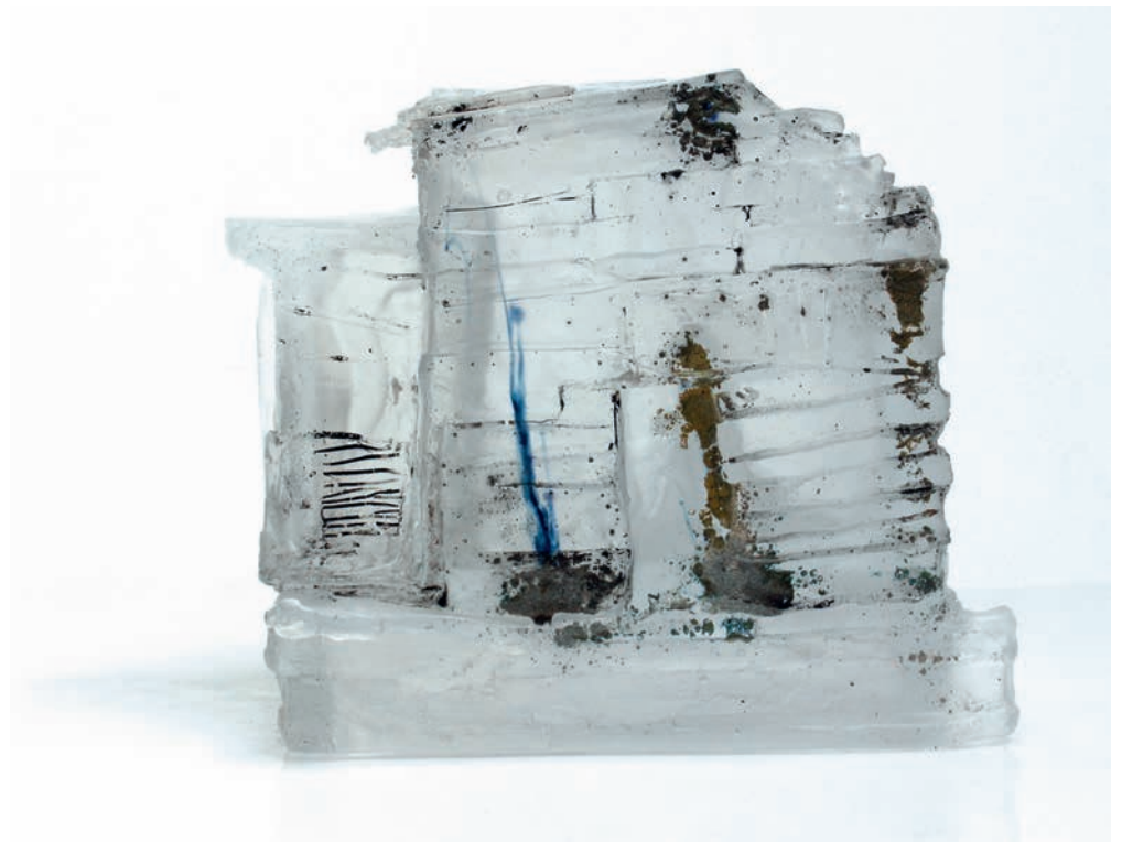
Maison cabane, émail intégré à la pâte de verre, 2017